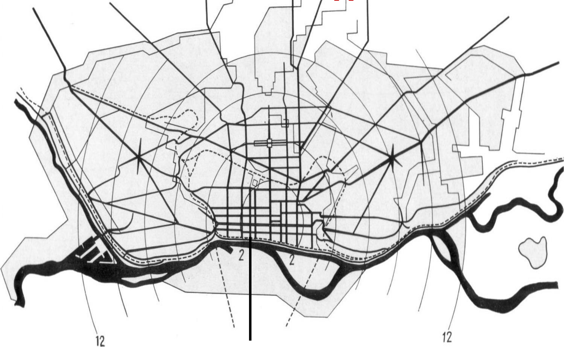
Эскиз города на 1,5 млн. жителей академика Александра Иваницкого, 1928г..