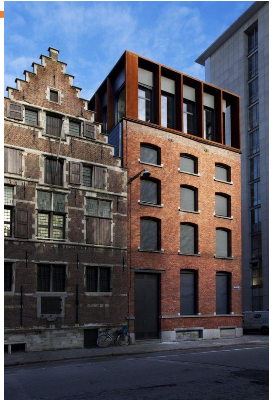
Могу vs Хочу