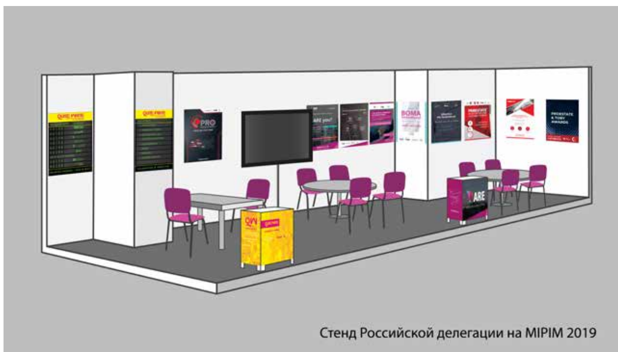
Стенд Российской делегации на MIPIM 2019

Общий интерактивный план выставки доступен по ссылке .