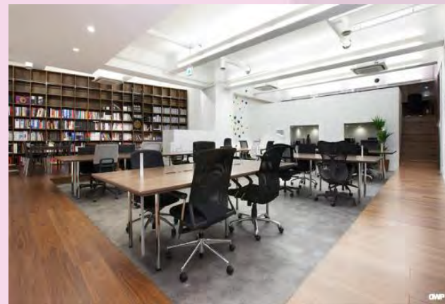
Токийский коворкинг MobOff