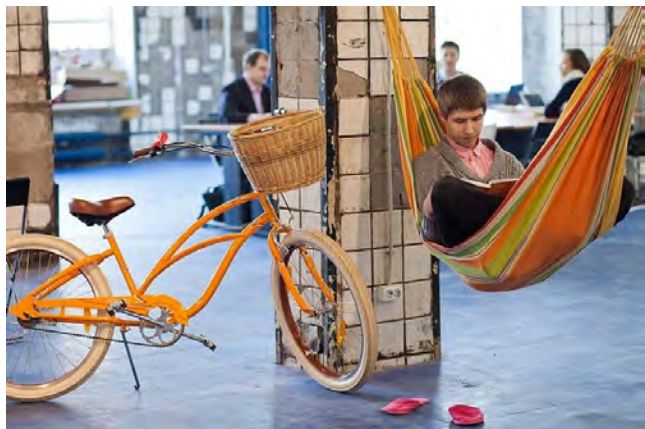
В 2007 году в Петербурге открыт лофт-проект «Этажи»

WeWork создана в 2010 г. , представлена в 40 странах, в том числе и в России